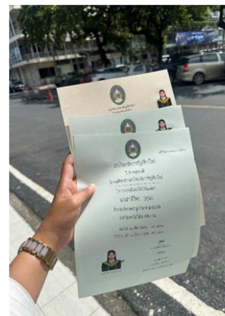
Diploma van Aom

“Thank you for your continued support over the years, I truly appreciate it. I hope you’ll be able to attend my graduation ceremony — I’ll send you the details soon. Thank you again!”