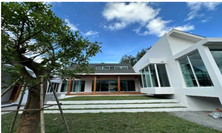
Afstudeerproject van Aom

In augustus 2025 heeft zij haar diploma ontvangen. In onderstaande mail bedankt ze de landcommissie voor de kansen die haar door de Talent foundation PVT geboden zijn: