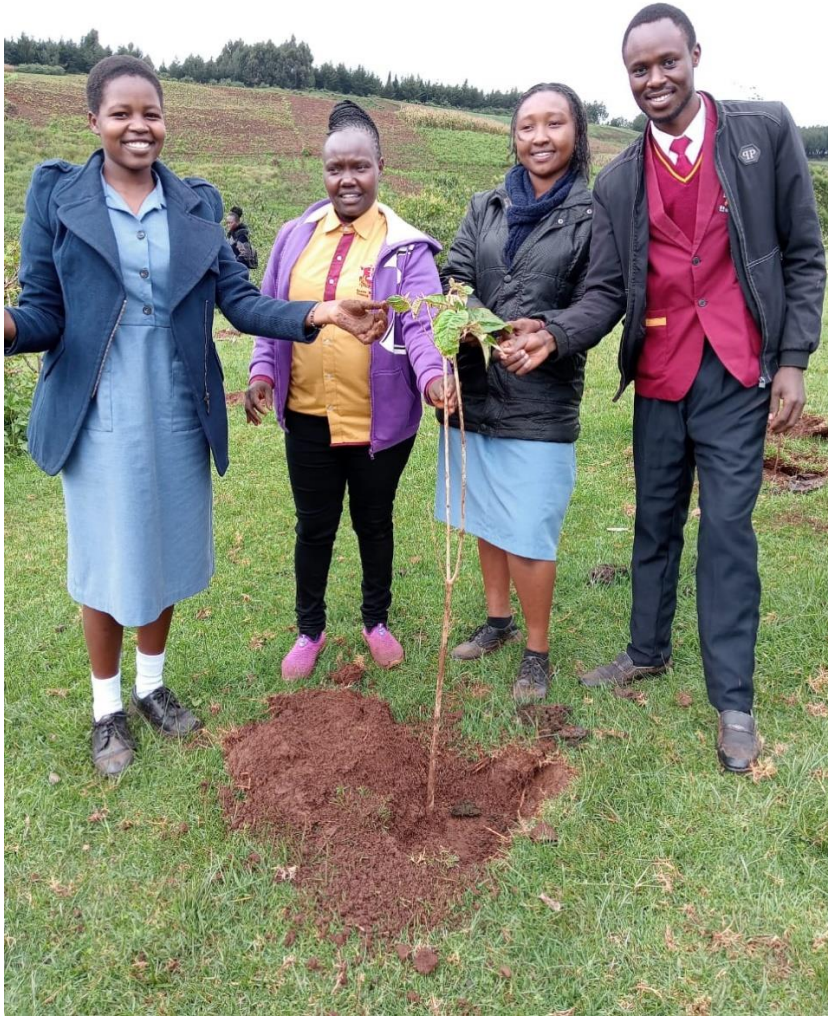
Meedoen aan de boomplant dag in een gebied waar ontbossing is geweest