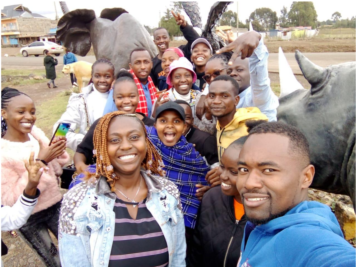
Op aardrijkskunde trip met de klas