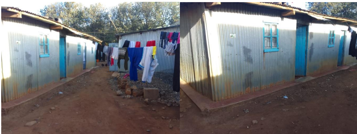
Hier heeft Obed een kamer