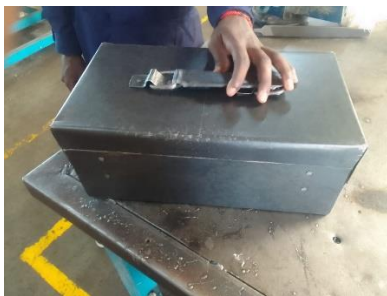
Making a tool box