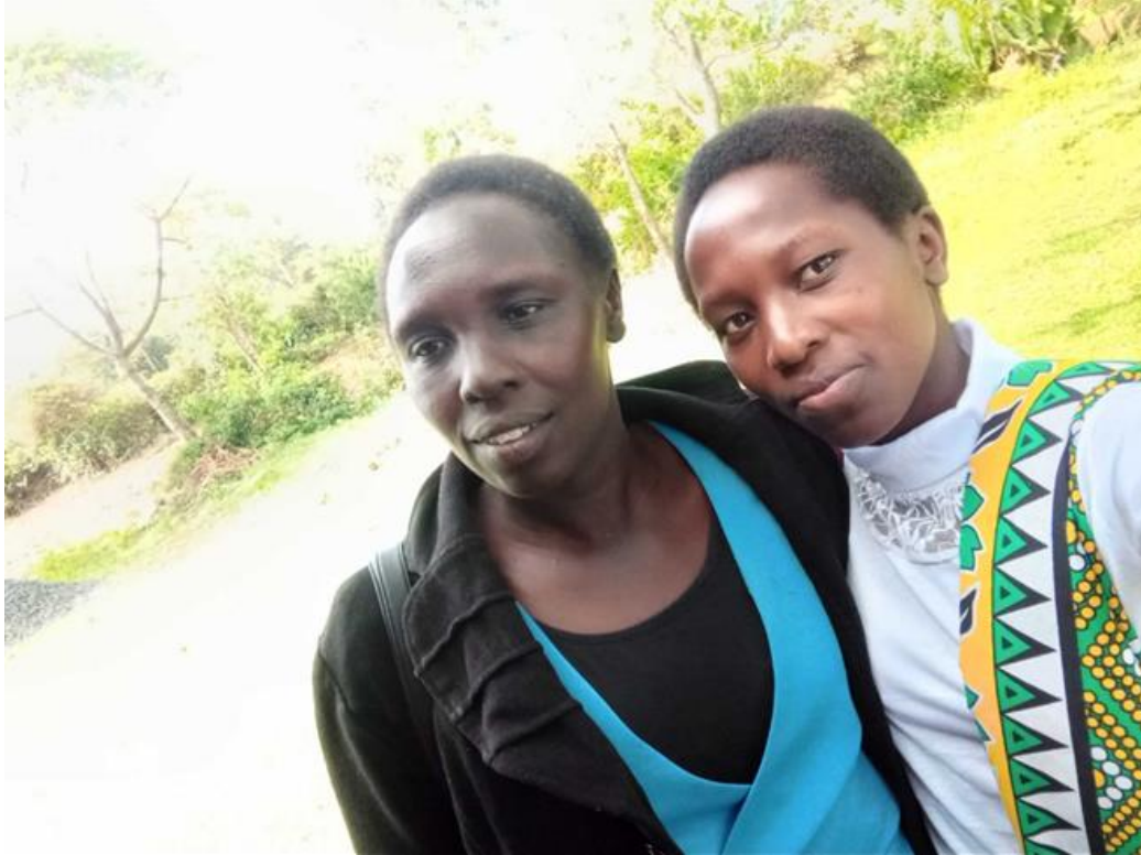
Links Elssy's moeder