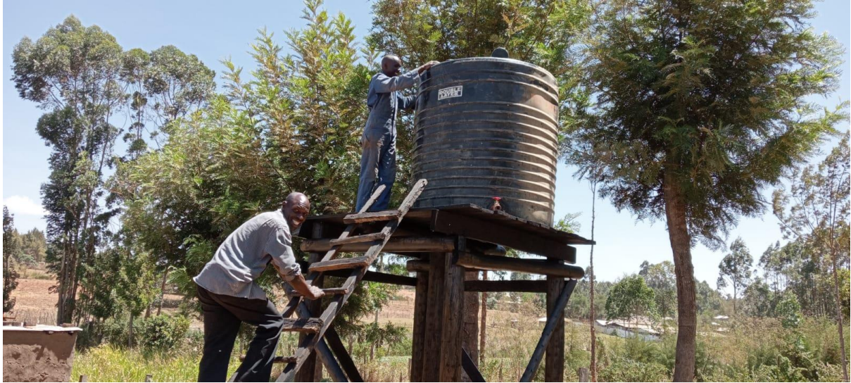
Instalieren van de watertank om watervoorraad voor de irrigatie mogelijk te maken