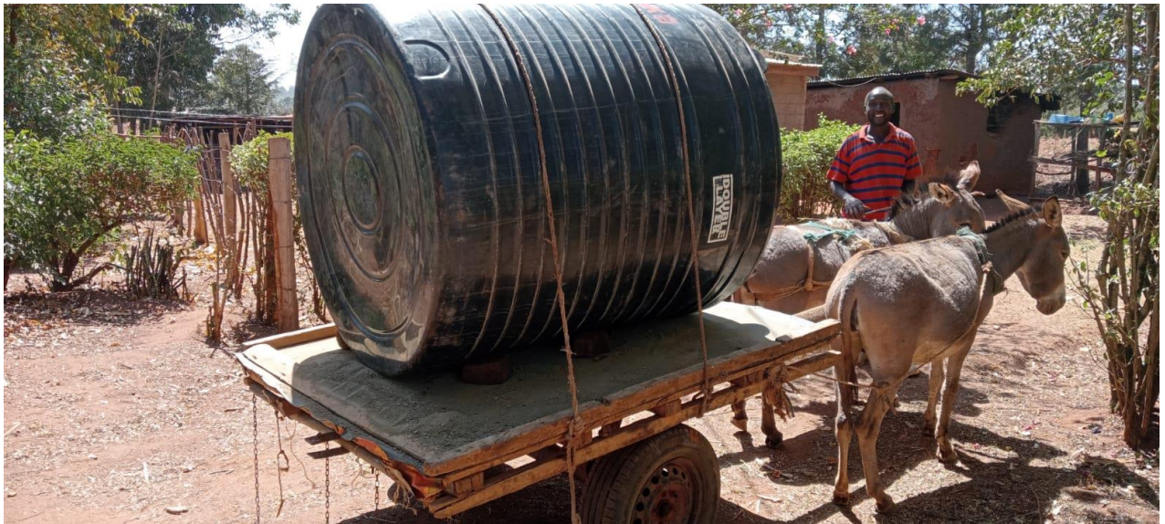
Het leveren van een grote watertank voor het project van Faith