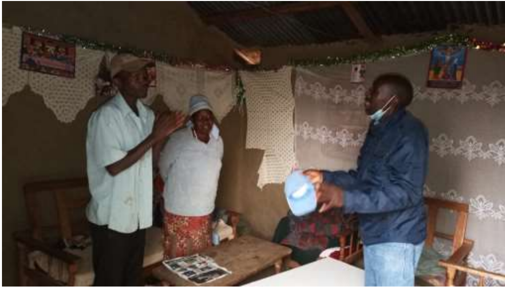
Bij Isaack thuis