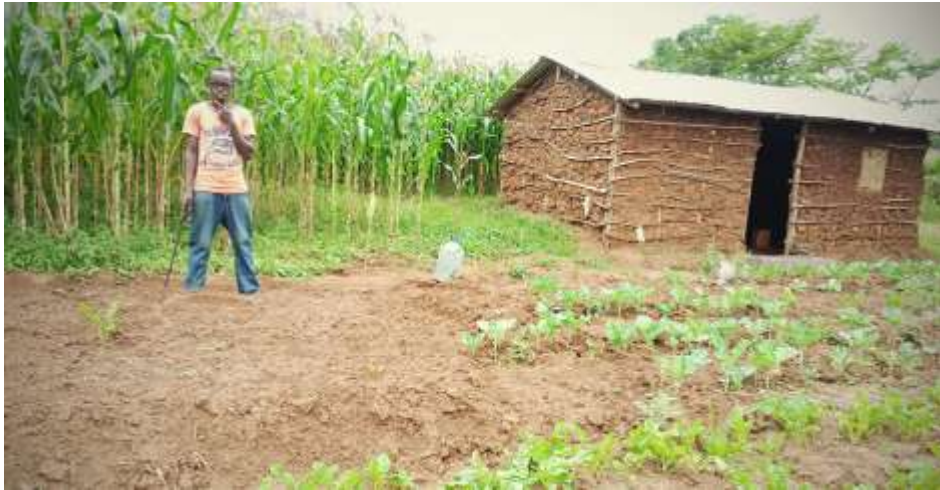
Het niet afgebouwde huis is van zijn broer die ook op betere tijden wacht om af te bouwen. Voorin groente en mais veld van Nicholas.