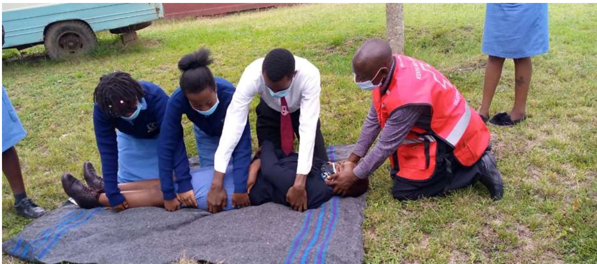
Eerste hulp sessie: practising log roll