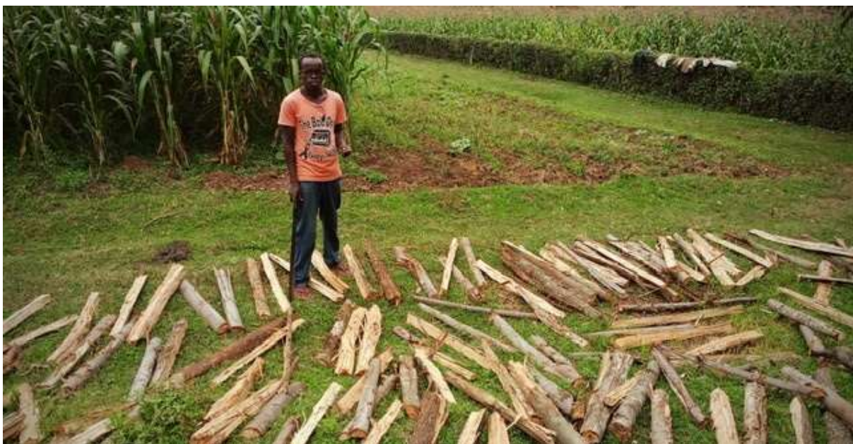
Het brandhout ligt te drogen voor de verkoop