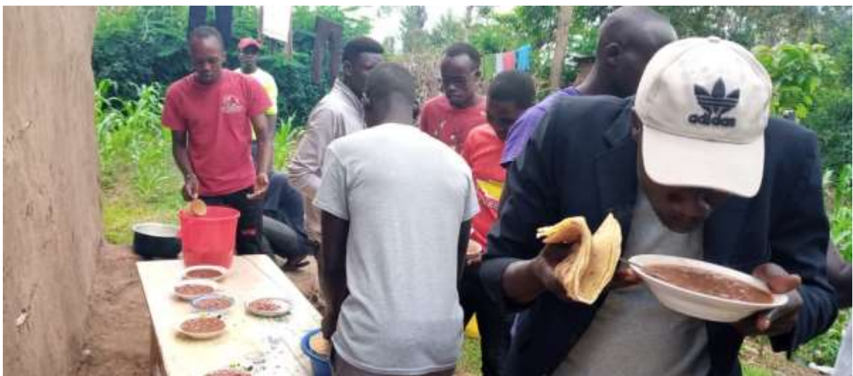
Samen vieren dat een van hun beter heeft! Met een bonen schotel met Chapati gemaakt van tarwedeeg en gebakken waren de jongens erg blij met hun lekker maaltijden op schoot of ergens op de grond.