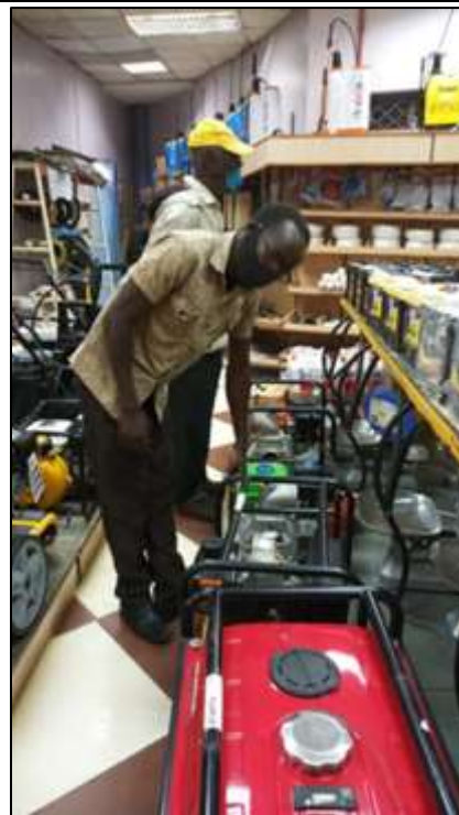
Inkopen vervoeren met de ezel en uitzoeken van generator in Kitale