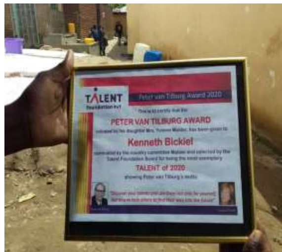
Het uitreiken van de PVT Award